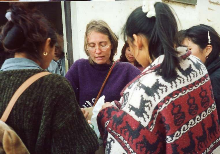
Kristalna, aux premiers ateliers de santé