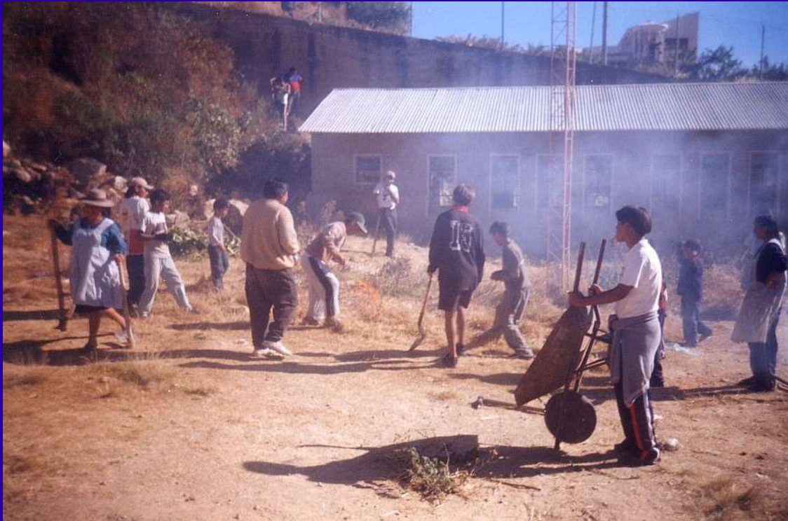
Préparation du terrain à Yurac Yurac